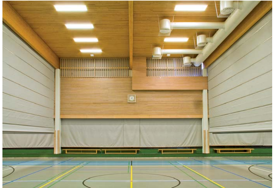
Juhlasali jaettu 2:lla jakoseinällä 3 osaan.