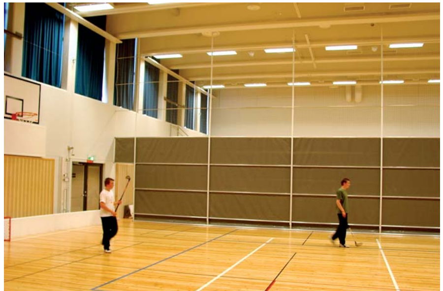
Verkolla varustettu NK1 Single