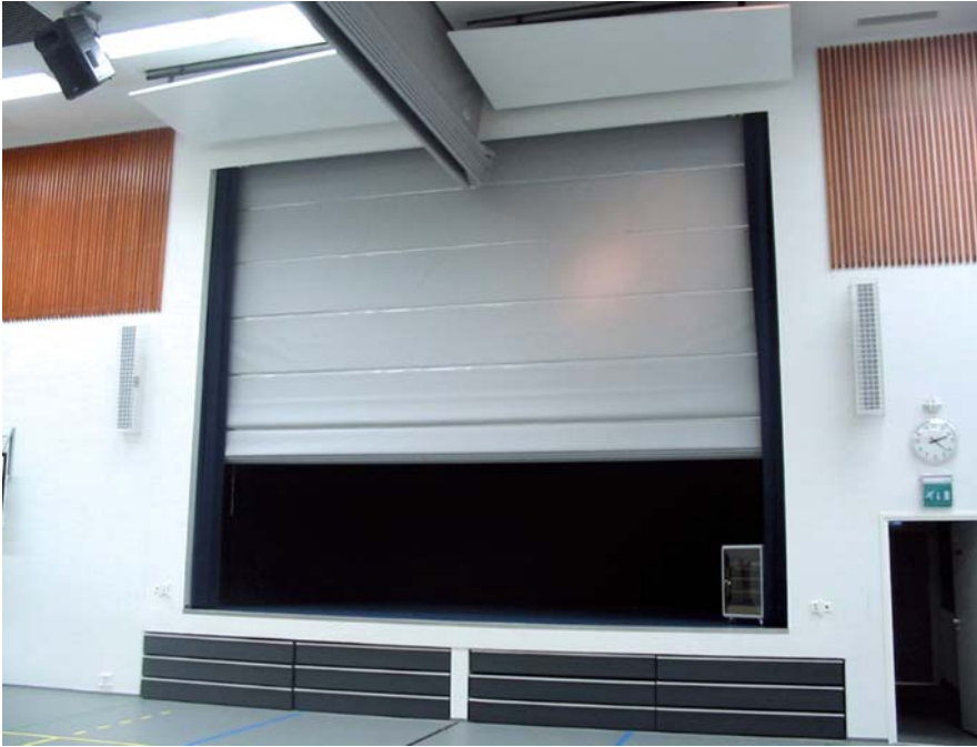
Näyttämön suojaseinä NK2