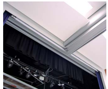
Näyttämön suojaseinä NK2 ja jakoseinä NK2 nipussa