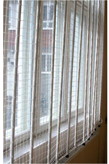
Sivuun siirrettävä pallonsoojaverkko