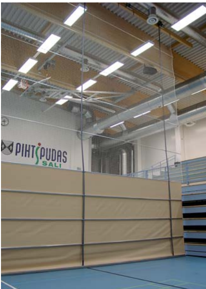
Verkolla varustettu NK1 Single