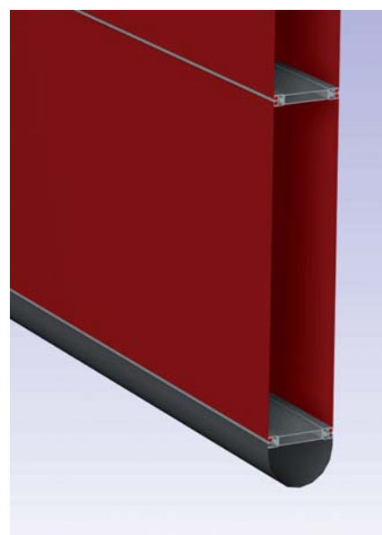
NK2 Double / NK4 Warm