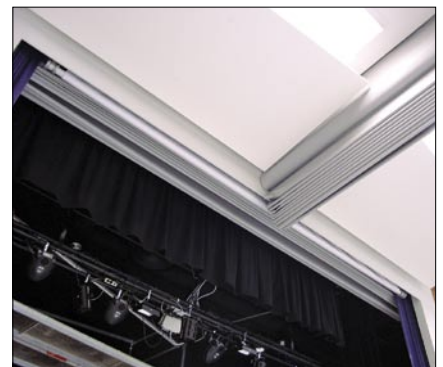
Näyttämön suojaseinä NK2 ja jakoseinä NK2 nipussa