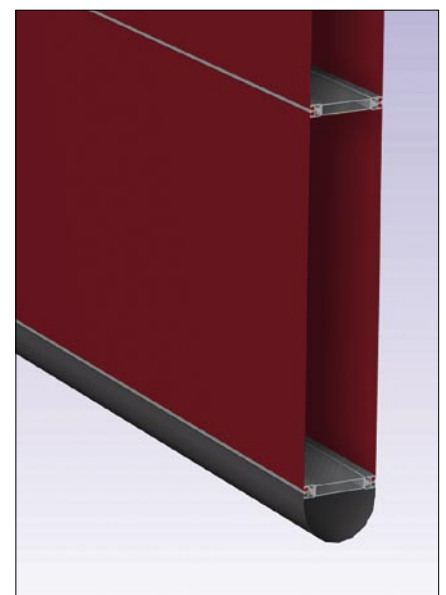
NK2 Double / NK4 Warm