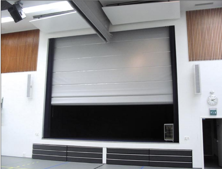
Näyttämön suojaseinä NK2