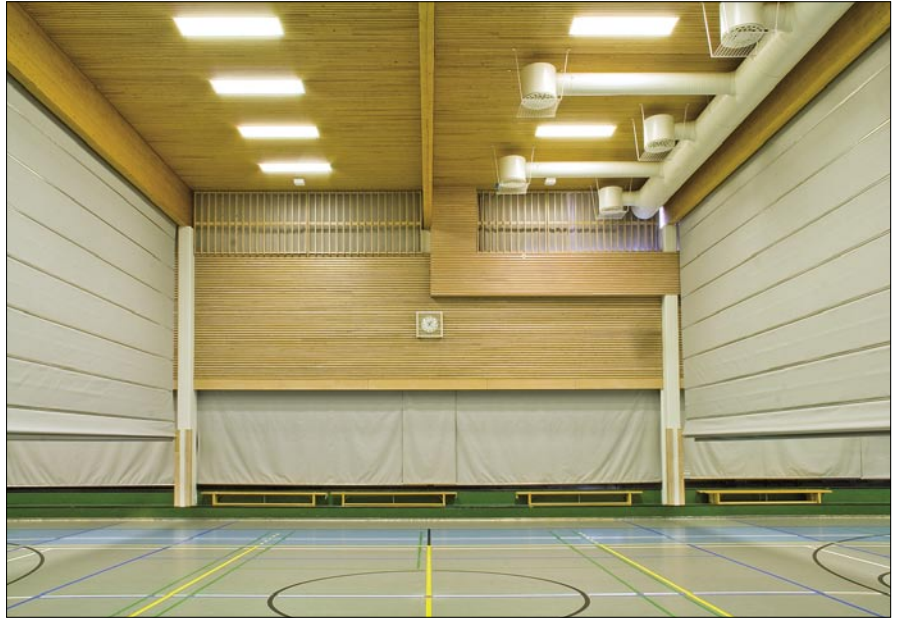
Juhlasali jaettu 2:lla jakoseinällä 3 osaan.