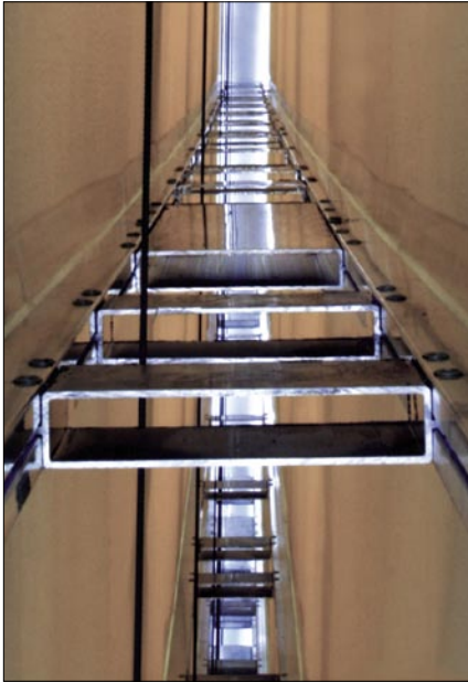
NK2 Doublessa ja NK4 Warmissa on tukeva alumiinirunko.