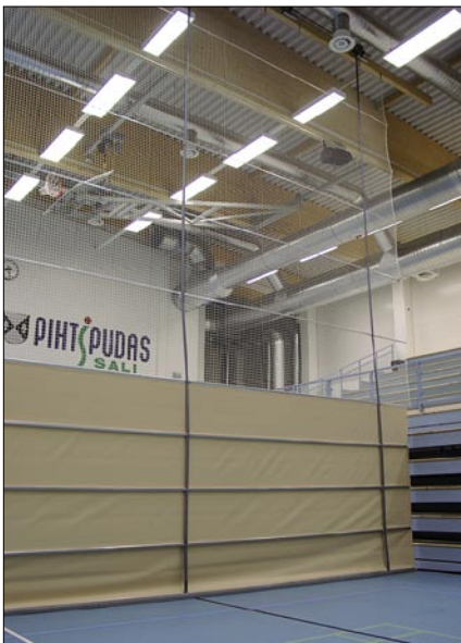
Verkolla varustettu NK1 Single