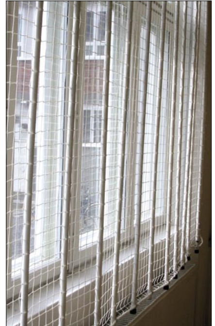
Sivuun siirrettävä pallosuojaverkko